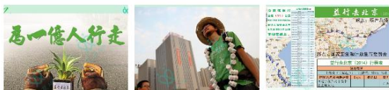
建言乙肝药物降价